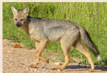
Jackal, Side- tribed/Streifenschakal