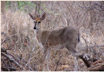
Ducker, Grey/Ducker, Grimm's (Common)