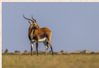
Red Lechwe/Black Lechwe/Kafue