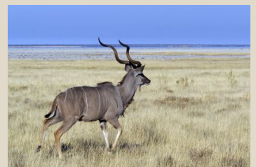
Kudu, Greater/Kudu, Großer