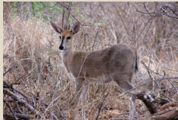
Ducker, Grey/Ducker, Grimm's (Common)