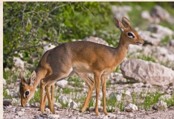
Dik Dik, Kirk's/Dik-dik Zwergrüsselantilope