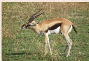
Thomson- Gazelle/Thomson's Gazelle