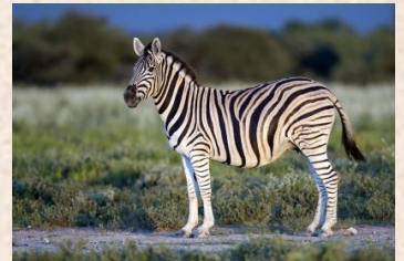
Burchell's Zebra/Zebra, Steppen