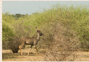
Kudu, Lesser/Kudu, Kleiner