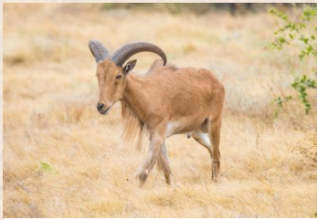
Barbary Sheep/Afrikanischer Tur