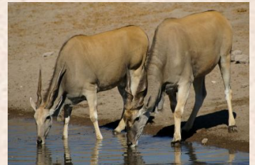
Elenantilope, Livingstone, Patterson's