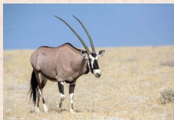
Oryx, Gemsbok/Oryx, Spießbock