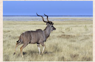
Kudu, Greater/Kudu, Großer