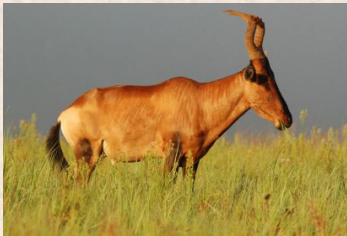
Hartebeest, Red/Südafrikanische Kuhantilope