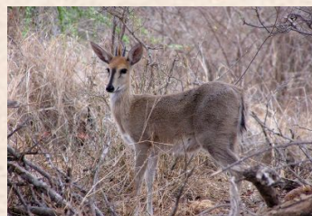
Ducker, Grey/Ducker, Grimm's (Common)