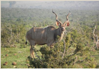
Kudu, East Cape/Kudu, Ostkap