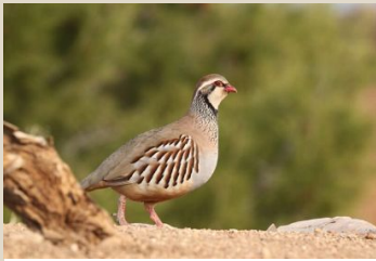
Rebhuhn / Steinhühner